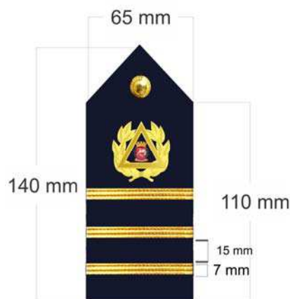
Platina sobreposta Amovível